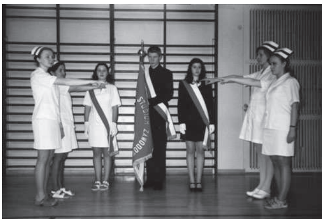
Fot. 12. Poczet sztandarowy w czasie uroczystości ślubowania absolwentów Medycznego Studium Zawodowego (2001)

Ślubujemy Ci Szkoło dbać o twój honor i godność ucznia, osiągać dobre wyniki w nauce, wychowaniu i pracy społecznej, dbać o dobro społeczne. Wynieść z twych murów gotowość niesienia pomocy ludziom w ochronie najwyższej wartości jakimi są życie i zdrowie oraz szacunek dla tych ludzi pracy, którzy walczyli i walczą o lepszą przyszłość i dobro człowieka.